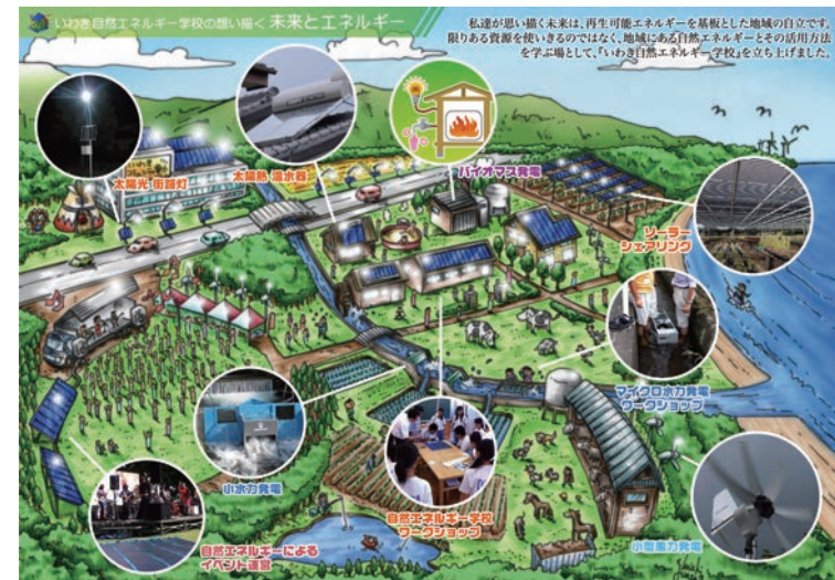
いわき自然エネルギー学校の思い描く未来とエネルギー