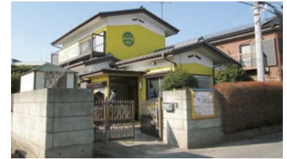
ボランティアの手で再生した住宅にあるJUNTOSの事務所