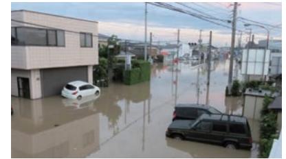
浸水時の常総市内 (2015年9月)