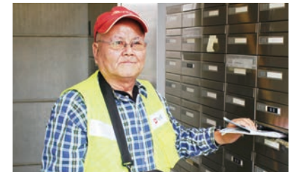
地域雇用とまちの安心安全をテーマにはじまったポストディンク事業も住民創発プロジェクトの活動のひとつ。

※Wellness & Walkable/Intelligence & ICT/Smart・Sustainable & Safety/Ecology・Energy & Economyの頭文字をとった造語で「賢いまちづくり」という意味を含めた。2017年度以降も継続の予定で進行中。