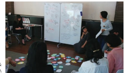
「WISE Living lab」の活用主体は地域住民。子育て現場の悩みや課題だと感じる事を出し合う会も開催された。