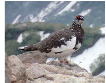
ライチョウ

での行動範囲が広く人数も多い。また、鳥や自然が好きな人が多く、温暖化や自然環境の変化に対する感度も高いと考えている。ツアーでは座学でモニタリングの意義、ライチョウの生態や山の基礎情報を聞いた後、ハンディタイプのGPS機器を携えて山に入り、使い方を学ぶ。普段は各々で登山をしているのに、専門家と一緒に山に入れるということも魅力につながっているようだ。