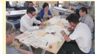
2015年:協働取組加速化事業における多様な主体による対話の場づくり(岡山県倉敷市)

〒150-0001 東京都渋谷区神宮前5-53-67 コスモス青山B1F TEL:03-5468-8405 FAX:03-5468-8406 http://www.epc.or.jp/