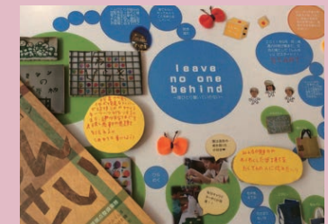
Leave No one Behindは大切なメッセージ

福島第一原発事故の後に避難生活を送る障害者を支援しているNPO法人しんせいは、企業の人たちとつながりながら、継続的な事業づくりに挑戦しています。これまで「つながりのかばん28(ふたば)」や「魔法のおかしほるほるん」などを開発・販売しました。「役割を持った生活を送りたい」という障害を持った人たちの想いは、SDGsの理念「Leave No one behind」につながると、しんせいの人たちは感じています。