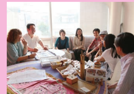
スタジオのロビーには地域に暮らす多様な人たちが訪れる

「FMわいわい」は、阪神・淡路大震災の経験をもとに、人種、民族、国籍、言語、宗教、年齢、性、障害のあるなしに関わらず市民一人ひとりが自分らしく生かれる社会をつくるため、NPOが神戸で開設した多文化・多言語放送局です。「コミュニティをつなぐ」ことを目的とした「市民参加型」、「多文化共生」の運営方針は、他の地域の模範になり、東日本大震災の後には、岩手県大槌町などで臨時災害FM局などの開設を支援しました。