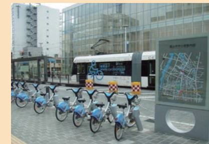
富山市内を走るLRT「富山ライトレール」と自転車市民共同利用システム「アヴィレ」

富山市は、早くから超高齢・人口減少社会を見据えて、過度に車に頼らない「公共交通を軸としたコンパクトなまちづくり」を基本政策に打ち出しました。自転車市民共同利用システム「アヴィレ」や、日本初の本格的LRT「富山ライトレール」の導入など、人と地球環境に優しいまちづくりが評価され「環境モデル都市」「環境未来都市」に選定された他、2014年には日本で初めてロックフェラー財団の「レジリエント・シティ」に選ばれました。