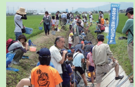
魚道での観察会(魚つかみ)の様子

昔、琵琶湖周辺の田んぼは、エサのプランクトンが豊富で外敵も少なく、ニゴロブナやナマズなどの魚にとって絶好の産卵・繁殖場所でした。滋賀県では今、開発によってコンクリートの排水路が作られたことで失われた琵琶湖と田んぼのつながりを、魚道によって再生し、いきもの豊かな田んぼを取り戻すことを目指す「魚のゆりかご水田プロジェクト」が、農家や都市住民、企業、学生、自治体など多様な人たちによって進められています。