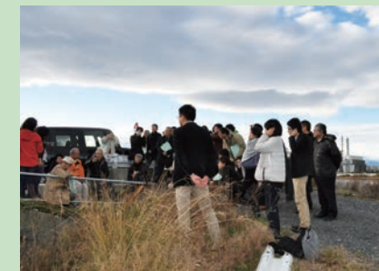
四日市市でのフィールドワーク

公害の教訓を伝える活動をつなぎ、公害学習の学びの環を広げるために、2013年「公害資料館ネットワーク」が結成されました。公害は昔のことと考えられがちですが、問題の解決には長い年月を要し、現在も訴訟が続いていたり、地域にリスクを抱えたままの地域も少なくありません。行政、企業、学術機関や市民団体らが共に学び、解決や再発防止に向けた行動が生まれることが期待されます。