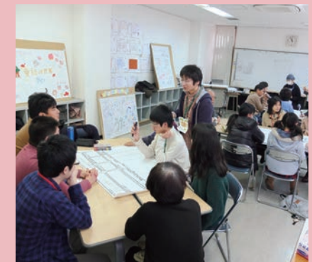
中学生によるワークショップ

学校だけではなく地域全体を学びの場にする取り組みが各地で進んでいます。広島市では、地域住民が中心となり、公民館やひろしまNPOセンターと協力し、中学生が情報発信を担い住民の声を集めながら、公園の活用プランを作成しました。世代や立場を越えたさまざまな人たちが参加し、多様な意見をとりまとめて行動する過程そのものが、持続可能な社会をつくる人材を地域に育てることにつながる