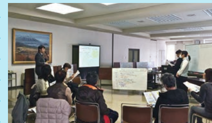
水道サポーターワークショップの様子

地域の水道の課題を住民の間で共有し、将来の選択を考えるために、岩手県矢巾町では2009年から「水道サポーター」を一般公募し、毎月ワークショップを開催しています。自分たちの使っている水の水源地や水質などについて学ぶことに加え、水道事業の実現についても知ることで、住民自らが、将来の水道料金の直上げも見据えた地域の未来の姿を自発的に考えていくことを促す活動として、全国的にも注目されています。